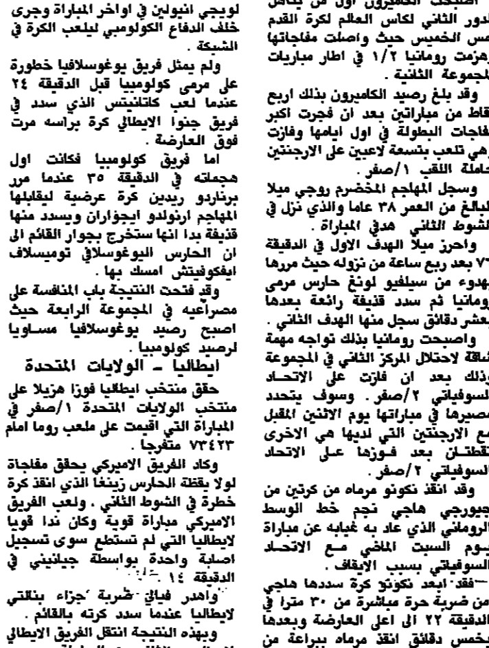
مينا يتلقى التهنئة